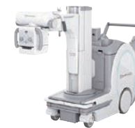
回診用撮影システム