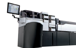
液体クロマトグラフ質量分析計